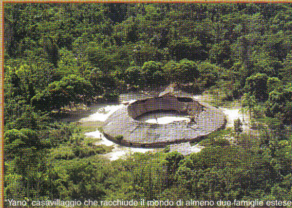
"Yano" casavillaggio che racchiude il mondo di almeno due famiglie estese