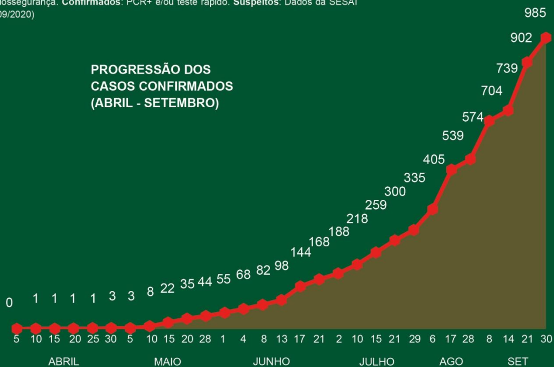
PROGRESSÃO DOS CASOS CONFIRMADOS (ABRIL - SETEMBRO)

Monitoramento realizado pela Rede Pró-Yanomami e Ye'kwana, com colaboradores e organizações indígenas.